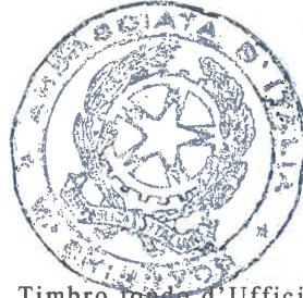
Timbro tondo d'Ufficio