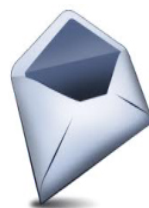
BUSTA PICCOLA DI COLORE BIANCO