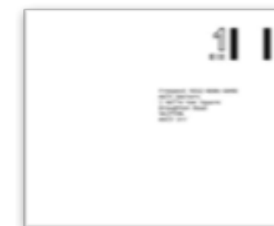
BUSTA PREAFFRANCATA per la restituzione al Consolato